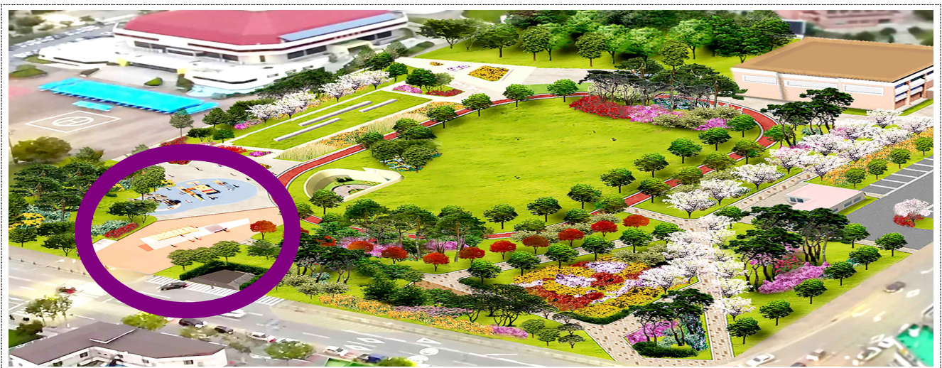
(구)충주공설운동장 공원 조성 계획 조감도